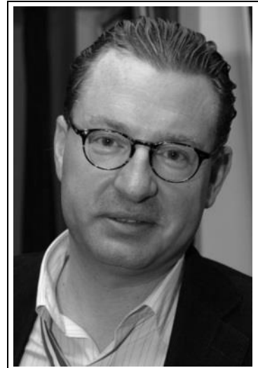
Kai Diekmann

In den Druck geht die BILD in mehreren Städten, wenn auch der Sitz der Axel Springer AG Berlin ist. In weiteren europäischen Städten wie Madrid, Palma oder Mailand werden ebenfalls Ausgaben der BILD als Auslandsexemplare gedruckt.