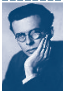
Aldous Leonard Huxley 1894–1963