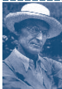
Hermann Hesse 1877–1962