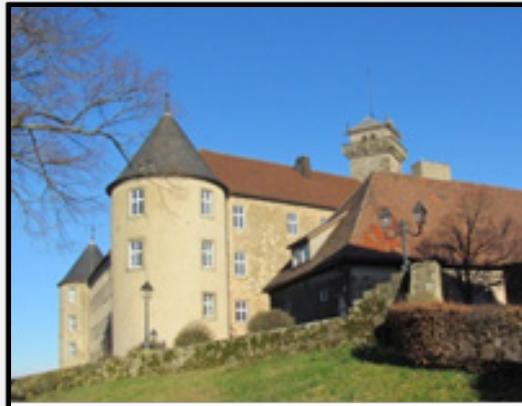
Schloss Waldenburg in Nordwürttemberg