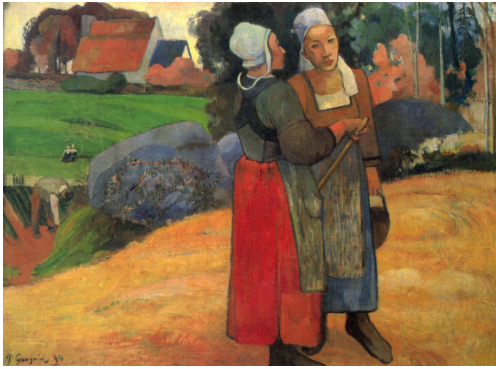
Paul Gauguin Bretonische Bäuerinnen 1894