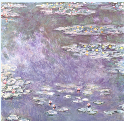
Claude Monet Seerosenteich 1908

Das Hauptmotiv kann fehlen. Ein Bild zeigt zwei oder mehrere Nebenmotive .