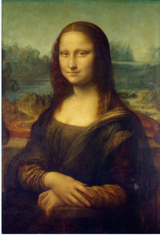
Leonardo da Vinci Mona Lisa 1503-1505

i Bilder haben im Regelfall einen Inhalt, ein oder mehrere Motive.