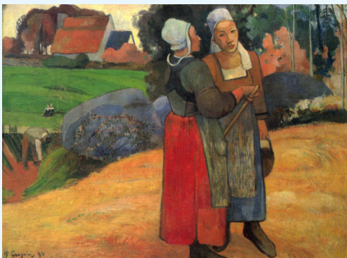
Paul Gauguin Bretonische Bäuerinnen 1894

Viele Bilder haben ein einzelnes Motiv, das Hauptmotiv, auf das sich sofort der Blick richtet. Es steht im Regelfall im Vordergrund. Einige kleine untergeordnete oder nebensächliche Motive können es umgeben. Mehrere Figuren oder Objekte können das Hauptmotiv bilden, zum Beispiel eine Ansammlung von Menschen, Pflanzen oder Tieren.