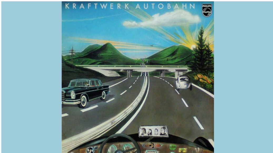
Cover des Albums „Autobahn“ (Philips/Vertigo 1974).