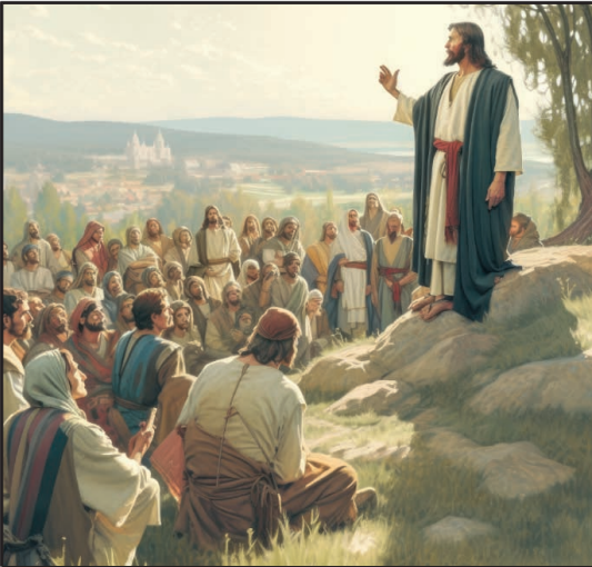
Jesus zieht als Wanderprediger durch das Land und erzählt den Menschen von Gott

Nach seiner Taufe verließ er seine Familie und zog als _____ durch das Land.