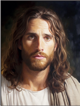
Jesus von Nazareth

Das Wort Christentum leitet sich von Jesus Christus her, der vor mehr als zwei Jahrtausenden in Galiläa lebte. Kein Mensch hat die Weltgeschichte so verändert wie er. Das Christentum bildet weltweit die größte _____. Über 2,5 Milliarden Menschen, etwa ein Drittel der aktuellen Weltbevölkerung beziehen sich in ihrem Glauben auf ihn. Das Neue Testament gilt als die wichtigste Quelle der historischen Jesusforschung.