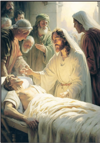
Jesu heilt einen Kranken

Etwa ab dem Jahr 28 begann sein öffentliches Wirken. Jesus begann zu _____, wie Johannes. Er blieb aber nicht in der Wüste wie Johannes und die Qumranleute, sondern zog durch _____ und Judäa. Die Zeit für das öffentliche Wirken Jesu ist kurz. Das Johannesevangelium erwähnt mindestens drei Passahfeste, andere rechnen nur mit einem Jahr. Ein Zentrum seines Wirkens war das Haus des Petrus und seiner Familie in _____.