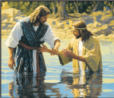
Jesus Taufe durch Johannes im Jordan

in Galiläa verbracht. Alle vier Evangelien nennen Nazareth in Galiläa als Jesus Heimatstadt, in der er aufwuchs. Nazareth war damals ein unbedeutendes Dorf mit ca. 400 Einwohnern.