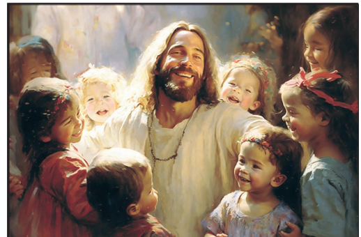
Jesus liebte besonders die Kinder

Die selbstverständliche Inanspruchnahme göttlicher Vollmacht brachte Jesus aber auch immer wieder in _____ mit den religiösen Führern seines Volkes, den Schriftgelehrten und Pharisäern. Auch seine Zuwendung zu den Ausgestoßenen und Verachteten der damaligen Gesellschaft führte oft zu Kritik. Besonders war er den Kindern zugetan.