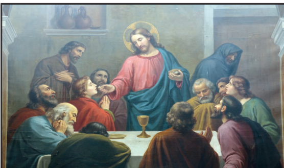
Jesus feiert mit seinen Jüngern das letzte Abendmahl

Bei den vielen Wundern verletzte er häufig das jüdische _____. Sein Durchbrechen des jüdischen Gesetzes hat ihm möglicherweise das Leben gekostet, da er in den Augen frommer Juden eine Gefahr für die Rechtgläubigkeit darstellte, indem er die vielen _____ des jüdischen Gesetzes durch sein allgemeines Liebesgebot ersetzte.