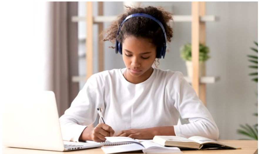
Mit h5p ist ein Diktat auch im Fernunterricht möglich.

Eine der klassischsten, vielleicht sogar die klassischste Form der Deutschklausur ist das Diktat (auch unter dem Begriff „Nachschrift“ bekannt). In vielen Bundesländern sind Lehrkräfte durch die Notenverordnung (NVO) sogar dazu verpflichtet, in den Klassen 5 bis 7 der Gymnasien und den Klassen 5 bis 9 der Realschulen eine Nachschrift zu schreiben. Zugleich steht das Diktat aber schon seit vielen