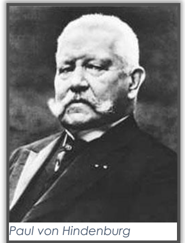
Paul von Hindenburg

Schließlich ernannte Reichspräsident Paul von Hindenburg Adolf Hitler zum Reichskanzler. Nach dem Tod Hindenburgs 1934 übernahm Hitler auch das Amt des Reichspräsidenten. Er verbot die anderen Parteien, agierte als _____ und nannte sich der „Führer“.