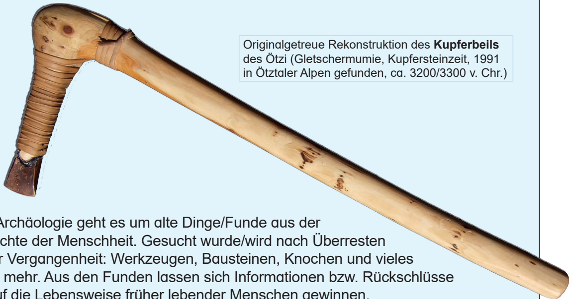
Originalgetreue Rekonstruktion des Kupferbeils des Ötzi (Gletschermumie, Kupfersteinzeit, 1991 in Ötztaler Alpen gefunden, ca. 3200/3300 v. Chr.)

In so einigen Büchern sowie digitalen Medien wird für die Archäologie kurzum auch der Begriff Alttertumskunde gebraucht. Doch diese Bezeichnung irritiert zum Teil. Die Wissenschaft Archäologie befasst sich keineswegs nur mit dem Altertum (= Zeit von ca. 3000 v. Chr. bis ca. 500 n. Chr.). Die Archäologie behandelt auch Zeiten vor und nach dem Altertum.