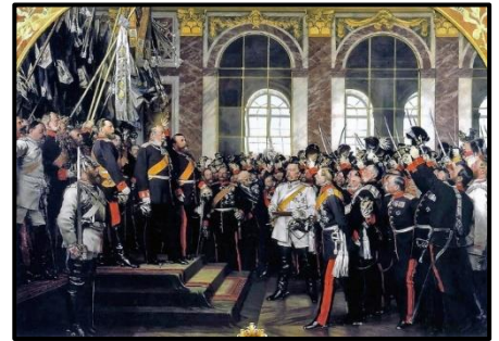
Kaiserkrönung im Spiegelsaal von Versailles

Preußen nutzte die große Begeisterung nach dem gemeinsamen Sieg der deutschen Staaten zur Gründung des Deutschen Kaiserreichs. Wilhelm I. wurde somit 1871 deutscher Kaiser und Staatsoberhaupt des neu gegründeten Deutschen Kaiserreichs. Die Krönung erfolgte im Spiegelsaal von Schloss Versailles bei Paris.