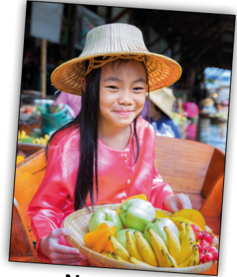
Narisara aus Asien (Thailand)