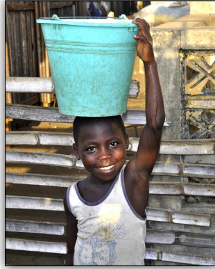
Bandele aus Afrika (Kenia)